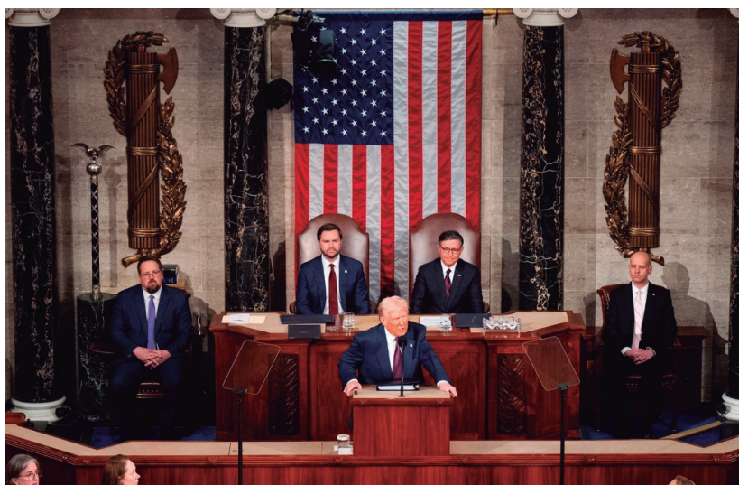
Congreso de los Estados Unidos