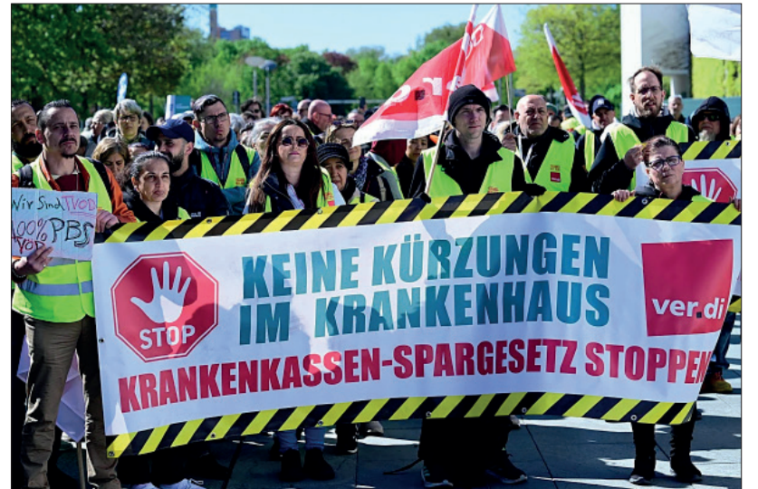
Manifestantes alemanes contra los gastos en defensa

El Gobierno alemán, de coalición entre socialdemócratas y democristianos, ha aprobado recortes que suponen un duro golpe a la sanidad, las pensiones y el seguro de desempleo. El principal objetivo de estos recortes es financiar el enorme aumento del gasto militar que tiene previsto.