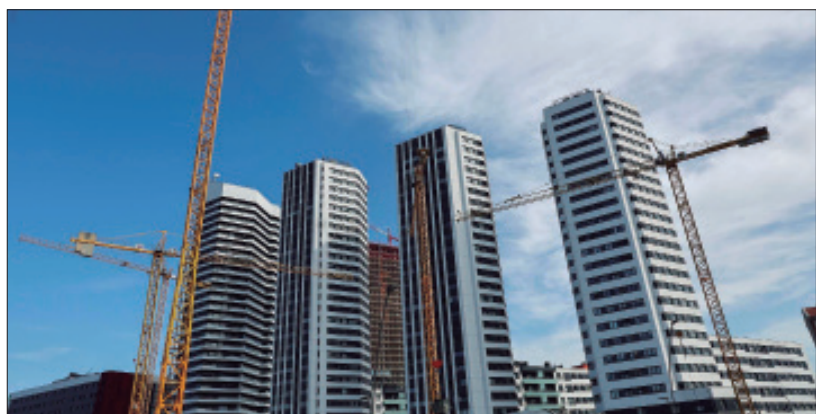
Zona de Garellano, Bilbao