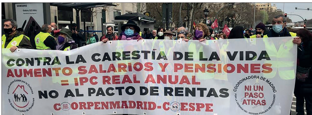
Manifestación de COESPE, Madrid

Actualmente la revalorización de las pensiones se calcula a partir del IPC medio, elaborado a partir de una cesta de bienes y servicios que no refleja el consumo real de las personas pensionistas. Esta cesta incluye partidas como ocio,