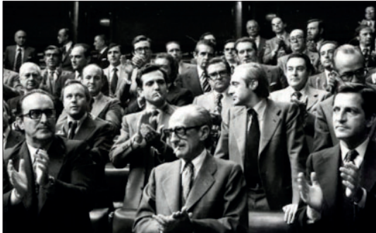
Votación en el Congreso del Pacto del Olvido

La tan careada desclasificación de algunos –que no todos– los archivos sobre el golpe de Estado del 23 de febrero de 1981 aparece como una maniobra –otra más– para salvar a la institución de la Corona, clave de bóveda del Régimen.