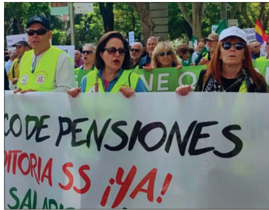
Manifestación por una pensión digna, Madrid

pera ampliamente la pensión media. La mayoría de las plazas residenciales están en manos privadas. Millones de pensionistas cobran me-