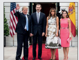
Felipe VI en La Casa Blanca

Según la prensa «Felipe VI llama a la contención en el uso de la fuerza y pide una salida diplomática, pero evita señalar la ilegalidad del ataque a Irán», por tanto no asume la posición del Estado español, expresada por el Gobierno. Felipe Borbón, según la Constitución, es irresponsable, por tanto no tiene derecho a expresar sus propias posiciones, debe repetir las del Gobierno.