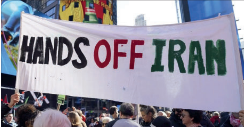
Manifestación contra la intervención en Irán, Nueva York

El 7 de octubre de 2023 se abrió una nueva etapa del intento de liquidación del pueblo palestino, obstáculo central del intento de reordenar todo el Medio Oriente en torno a Israel, vasallo principal del imperialismo norteamericano en la región.