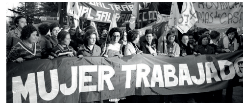
Manifestación 8M, Madrid 1980

El discurso oficial nos hablará de «nuevos protocolos», «formación en género» y «comisiones de investigación». Pero sabemos que no se puede desinfectar una herida si el