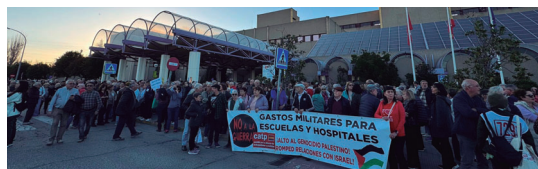
Un sanitario leyó el manifiesto por la sanidad pública en la concentración

huelga tiene como causa principal el rechazo de los médicos a las jornadas de trabajo interminables y las guardias de 17 o 24 horas. Es responsabilidad del Gobierno y de las Comunidades Autónomas dar solución a esta justa