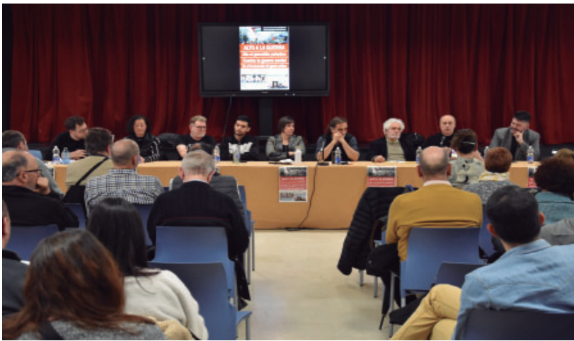
Mesa de participantes en el acto de Getafe contra la Guerra del pasado 3 de marzo