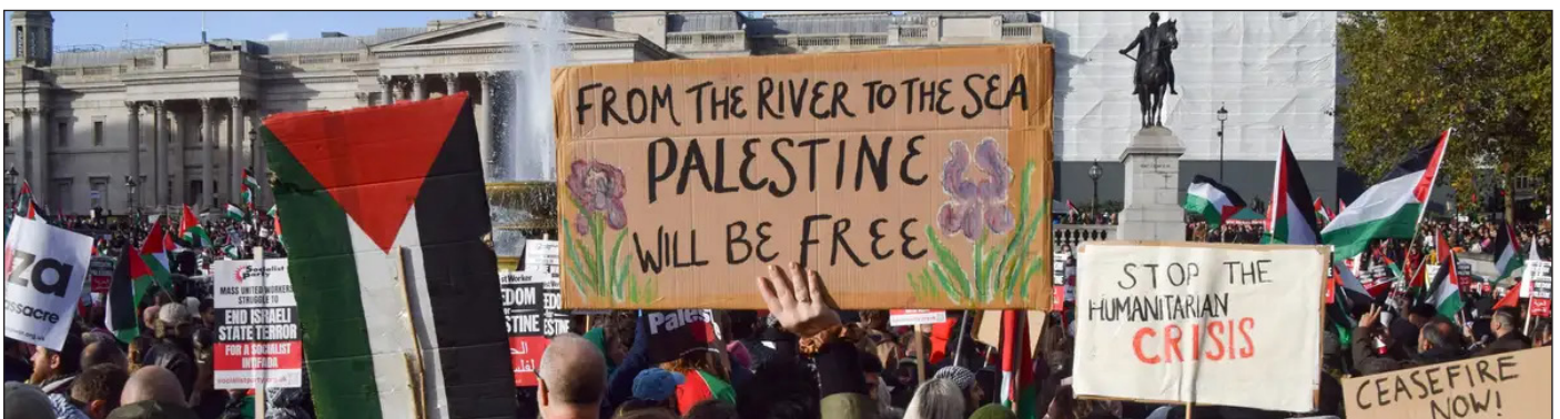
«Palestina será libre desde el río hasta el mar», la consigna que se escucha en manifestaciones por todo el mundo

No es una consigna genocida, sino un noble objetivo que exige la liberación de los palestinos del brutal apartheid y la liberación de la sociedad israelí del sionismo, permitiendo a palestinos y judíos convivir en una entidad igualitaria.