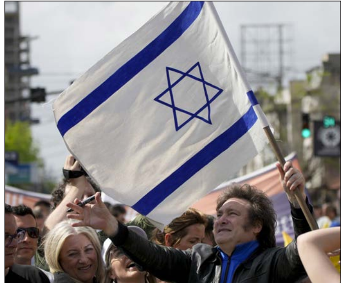
¿Milei tras los pasos de Israel?

Pero Milei, que cuenta con el beneplácito del FMI, también se apoya en la desilusión y la rabia de los sectores populares contra el peronismo y el gobierno anterior para continuar la ofensiva, ahora con la llamada “ley omnibus”, un proyecto de “ley habilitante” que