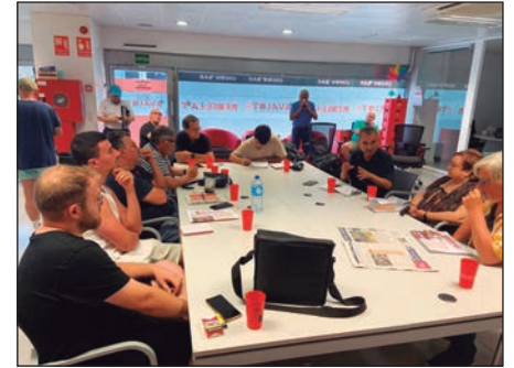
Seguimiento en Barcelona de la Conferencia Europea