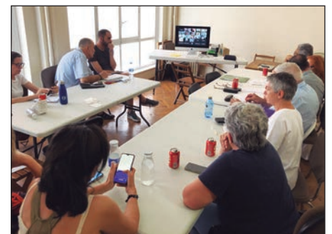
Seguimiento en Madrid de la Conferencia Europea