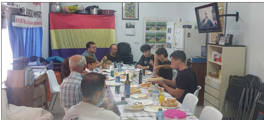
Getafe: el horario europeo de la Conferencia obligó a compaginarla con la comida en nuestro país

¡No a la Guerra! Muchos saludos desde España. Gracias, salud y fuerza!